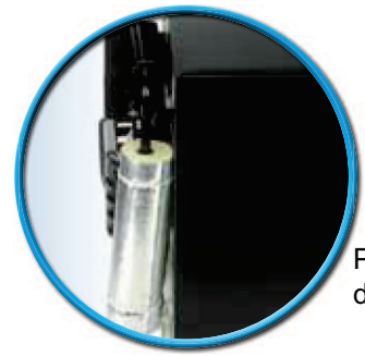
Particolare Frigobar da incasso