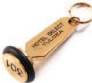
18118 Portachiave ottone cromo e plexiglass con gommino nero di protezione.