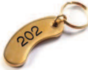
18141 Portachiave ottone lucido. Con gommino nero di protezione.