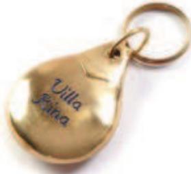
18117 Portachiave ottone lucido. Con gommino nero di protezione.