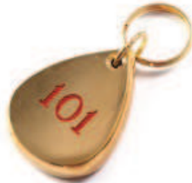
18144 Portachiave ottone lucido. Con gommino nero di protezione.